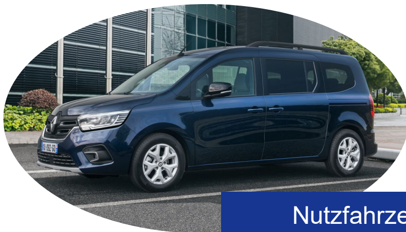
Nutzfahrzeug (Bsp. Renault Kangoo*)

* Eine Anhängerkupplung wird bei der Fahrzeugwahl mit berücksichtigt