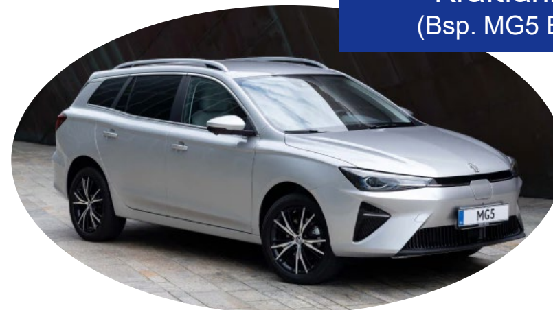
Kraftfahrzeug (Bsp. MG5 Electric*)

* Eine Anhängerkupplung wird bei der Fahrzeugwahl mit berücksichtigt