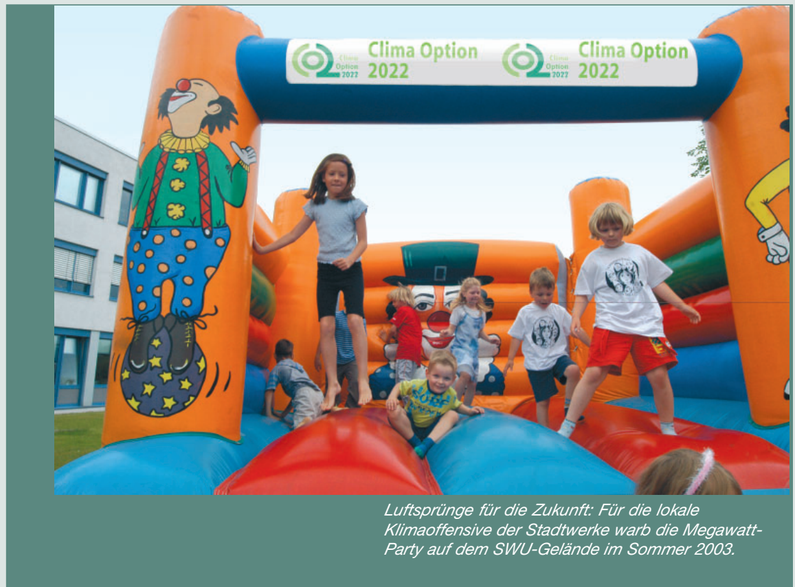
Luftsprünge für die Zukunft: Für die lokale Klimaoffensive der Stadtwerke warb die Megawatt-Party auf dem SWU-Gelände im Sommer 2003.