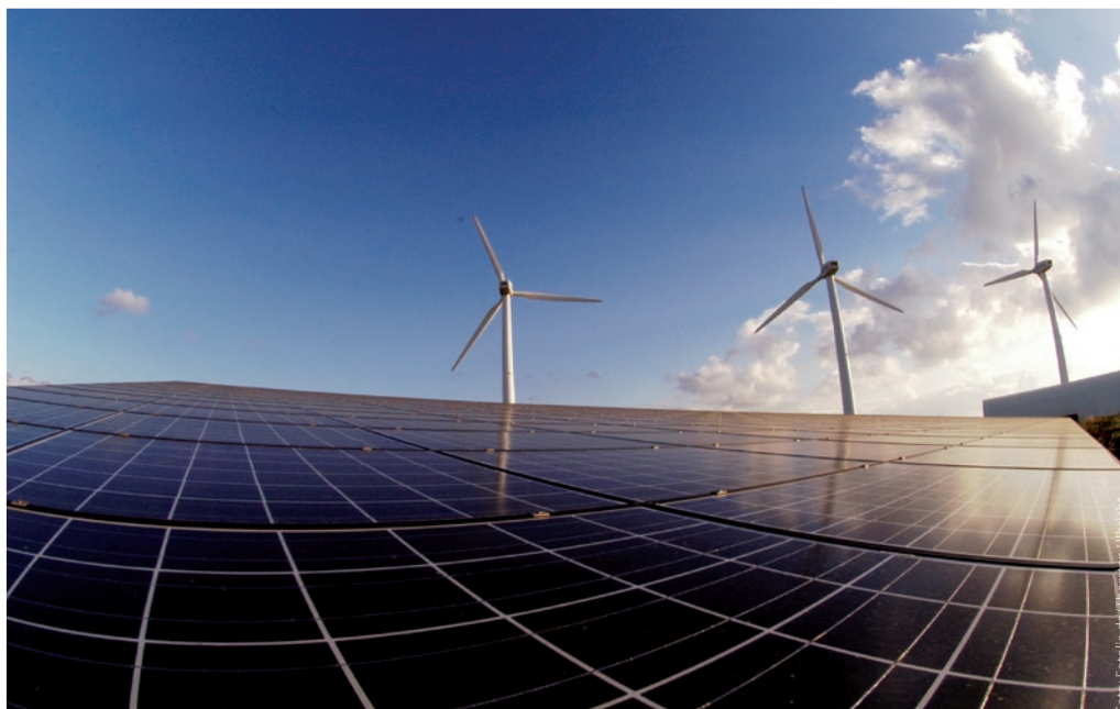
Ökostrom aus lokalen Quellen: Die SWU fördern diesen mit einem eigenen Investitionsprogramm.

Nutzen Sie die Erfahrung in umweltgerechter Energieversorgung