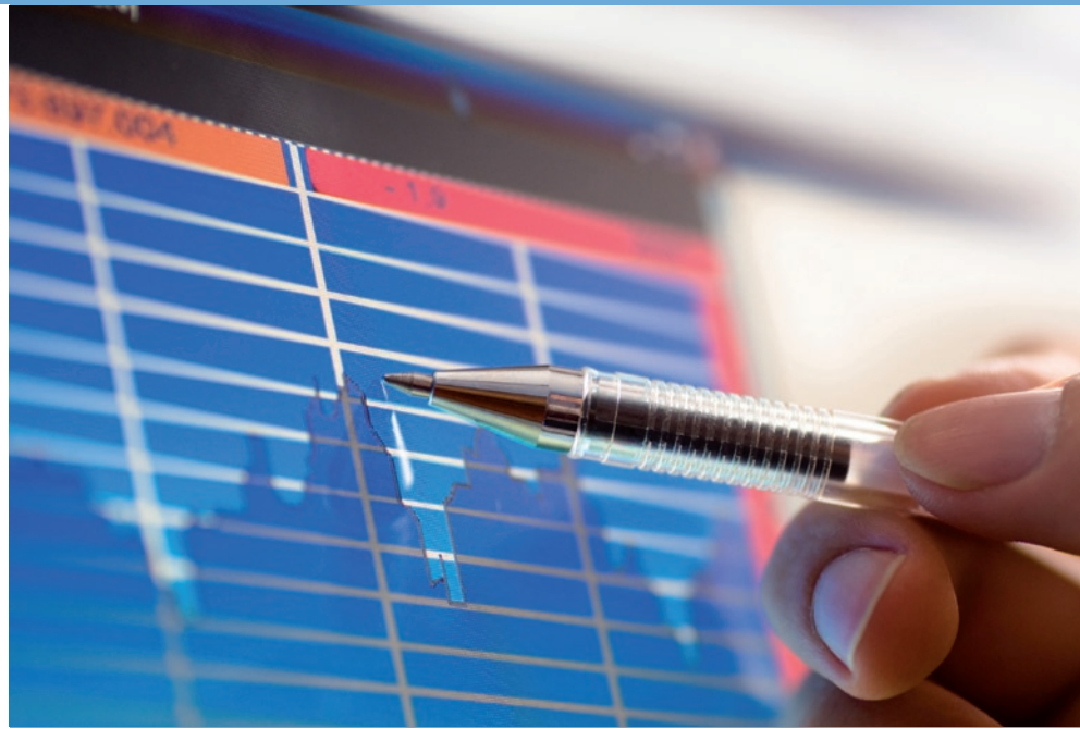
Die Fachleute der Stadtwerke bieten die bundesweite Lieferung für alle Standorte.

Bundesweit aktive Einzelhandelsunternehmen, Metallfirmen und Großhändler im Nahrungsmittelsektor haben dies erkannt und sparen effektiv Personal-, Regie- und Energiekosten: Sie überlassen es dem Geschäftskunden-Team der Stadtwerke Unna, für alle Standorte die optimalen Konditionen in einem Vertrag zu erfassen. So beliefern die Stadtwerke erfolgreiche Kunden zwischen Unna, Ostwestfalen und Schleswig-Holstein. Für